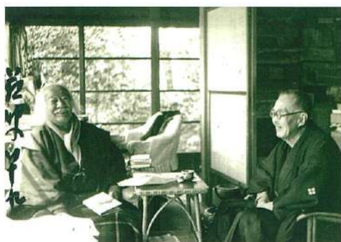
徳富蘇峰(左) 撮影時期/昭和二六年三月一七日、撮影場所/晩晴草堂

徳富蘇峰は、明治・大正・昭和の三代にわたって活躍した評論家、歴史家です。徳富家は、信綱の妻・雪子の実家である藤島家の姻戚にあたります。信綱と雪子の結婚を後押ししたのは蘇峰である、とは信綱の長男・逸人によるエピソードです。写真は、蘇峰が晩年を過ごした熱海の邸宅「晩晴草堂」にて昭和二六年(一九五二)に撮影されたもので、左端には蘇峰の直筆で「蘇叟八十九」と署名があります。蘇峰が手にしているのはこの年刊行された信綱の歌集『山と水と』でしょうか。にこやかな表情から、二人の間で交わされた様々な会話が想像できる一枚です。