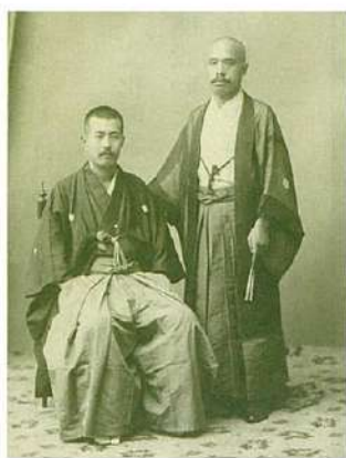
三浦守治(右) 撮影時期/推定明治二〇年代、撮影場所/玉翠館

大正期の病理学者で、帝大医科大学の初代病理学教授を務めた三浦。明治一四年(一八八二)に東京大学医学部を首席で卒業し、同期には森鷗外がいます。研究の傍ら信綱のもとで歌を学び、「自分も少し歌を学ばなかったならば、自分の学者的生命は早く枯渇したかも知りがたい」と語ったといいますが、その言葉通り研究・作歌の両道において優れた才能を発揮しました。