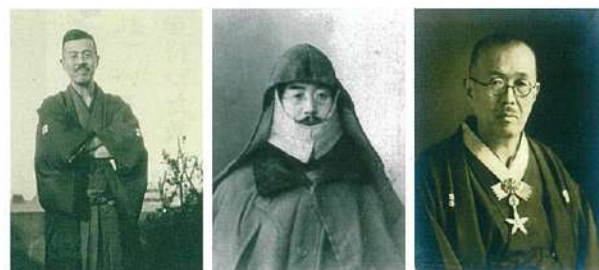
文化勲章を受けて (左:竹柏会大会にて、右:中国にて)

「ご本人の和歌ですよ」と折り本を頂いた覚えはあるが、どこかに紛れ込んでしまったらしくそれを見当たらない。先生からの手紙は、能筆なうえに、万葉仮名で書かれていたのでほとんど読めなかった、でも、いつも横にカナがふつてあったのを覚えている。先生が亡くなって、西山のお宅でのお別れには、父がすでに病に臥せていたので、私が代わりにお別れに行った。神を供えた記憶がある。