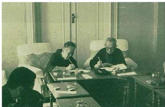
新村出(右) 撮影時期/昭和三〇年五月二六日、撮影場所/京都ホテル

言語学者である新村出は、『広辞苑』の編者としてもよく知られています。新村が明治四二年(一九〇九)に信綱を訪ねたことを機に、二人は五〇年来の親交を結びました。新村は竹柏会には直接属さなかったものの、信綱の影響で歌をよくしました。また十代の頃から『日本歌学全書』(佐々木弘綱・信綱編、博文館、一八九〇・一八九一)を購読するなど、国文研究においても信綱の学恩を受けたといえます。昭和三〇年(一九五五)五月に京都を旅した信綱は、二六日に新村の自宅を訪れており、同日京都ホテルで開催された竹柏会京都支部歌会にも顔を出しています。写真は歌会での様子を撮影したもので、同席した新村とは隣席であったことがわかります。