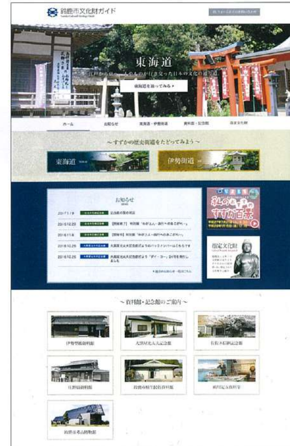
「鈴鹿市文化財ガイド」トップ画面

文化財課では、平成二八年二月に新ホームページ「鈴鹿市文化財ガイド」を開設いたしました。文化財課所管施設の最新展示情報のほか、市内指定文化財の紹介や街道マップの無料配布なども行っています。またパソコンのみでなく、スマートフォンからも閲覧が可能となっております。ぜひご活用下さい。