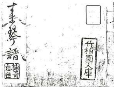
資料館所蔵『すま琴譜』