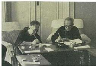
信綱(左)と新村出(右) 昭和30年

北川氏は、『広辞苑』の編者として知られる新村出と、信綱との間で交わされた書簡―佐新書簡(※)―から一部を紹介し、両者の交流の実態について発表されました。五十八年にわたる長い付き合いがあった信綱