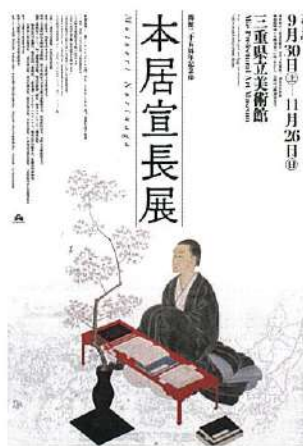
本居宣長展チラシ