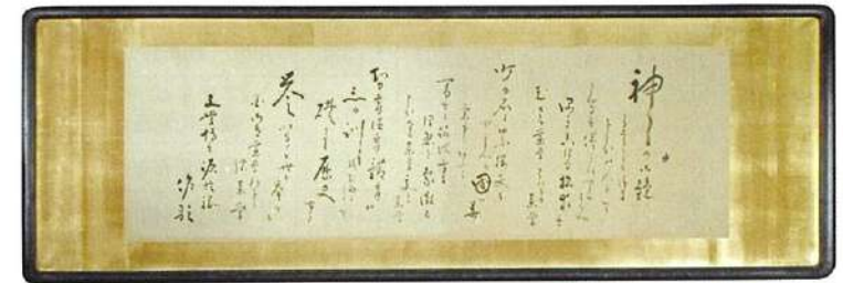
東京薬学専門学校女子部歌額(東京薬科大学所蔵)

折本『鈴鹿行』 昭和二十五年(一九五〇)の故郷訪問の際に「日記風にかきつけた」という七十一首を、その翌月、記念にと折本にして刊行したもの。石薬師で詠んだ「日