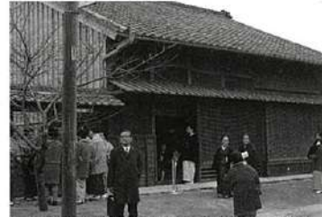
信綱生家が記念館に(昭和45年)